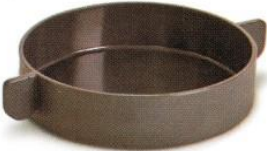
Large Silicone Cup